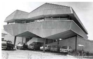
Ancien CAT Alpha