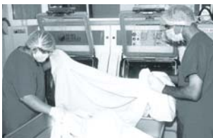
Blanchisserie ESAT C.Lanusse