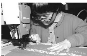
Ouvrière du CAT Coustau