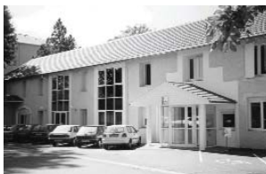
Siège Social ADAPEI