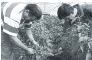
Maraîchage ESAT d'Espiute