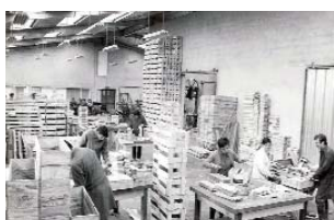
Ancien atelier CAT Colo

Les ressources de l'association proviennent d'une part des cotisations, de dons et de legs qui lui sont allouées pour la vie associative, et d'autre part des subventions et des financements publics - état, collectivités locales, sécurité sociale - pour le fonctionnement des établissements.