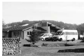
SAJ de Sauvagnon