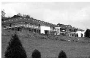
MAS de Rontignon